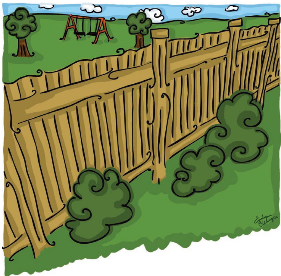
Illustration : Evelyn Bédange